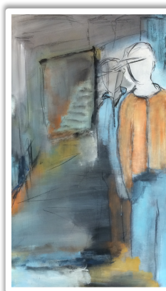
Still stairs to climb